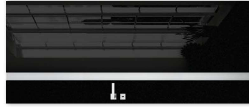
VETRO D2 moro