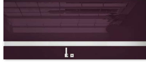
VETRO D2 vino