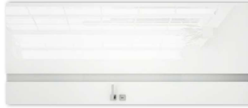
VETRO D2 bianco