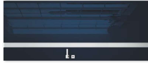
VETRO D2 notte